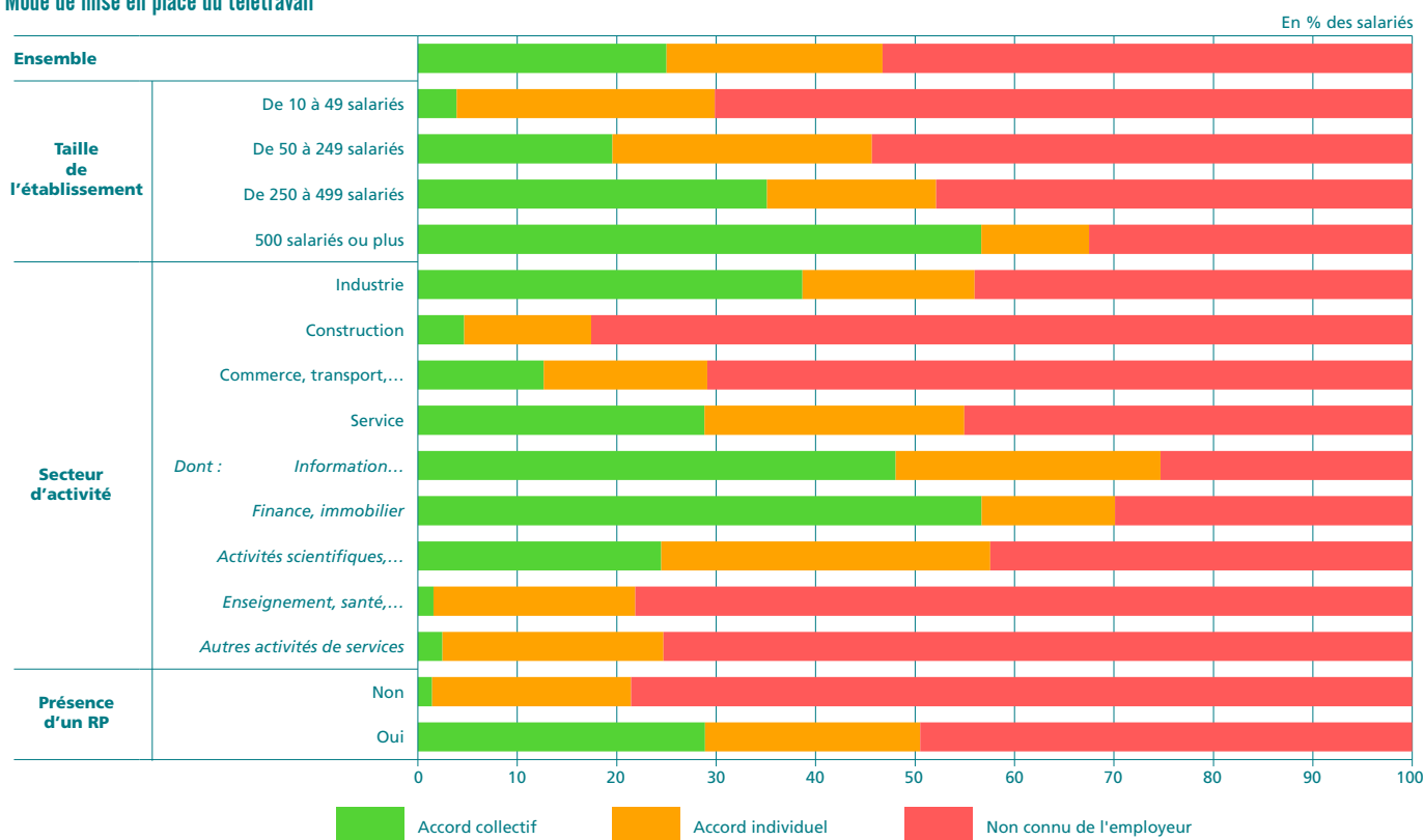
Graphique 2 Mode de mise en place du télétravail

Note : dans l'enquête Reponse, les salariés ont déclaré exercer tout ou partie de leur activité en télétravail sans préciser sa fréquence, régulière ou non. Lecture : 25 % des télétravailleurs travaillent dans un établissement où existe par un accord collectif sur le télétravail ; 22 % sont dans des établissements où l'accord sur le télétravail est uniquement individuel. Pour 53 % des télétravailleurs, la direction déclare que cette pratique n'existe pas dans leur établissement. Champ : salariés des établissements de plus de 10 salariés, secteur privé non agricole, France métropolitaine.